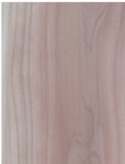
プレーナー仕上げ

道南杉ハル壁シリーズの仕上りは、商品・サイズによって異なります。外壁用は粗挽き仕上げ、内装用・モールディング・デッキ材はプレーナー仕上げとなっております。また、まれに画像のように一部が黒く変色した材が含まれる場合があります。