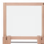
道南杉飛沫防止パネル 600 アクリル板 + 道産材土台 (2 個)

フレームには道南杉を使用しているので、気軽にオフィスや店舗に木の温もりを取り入れることができます。