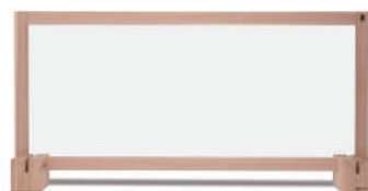
道南杉飛沫防止パネル 1200 アクリル板 + 道産材土台 (2 個)