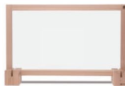
道南杉飛沫防止パネル 900 アクリル板 + 道産材土台 (2 個)