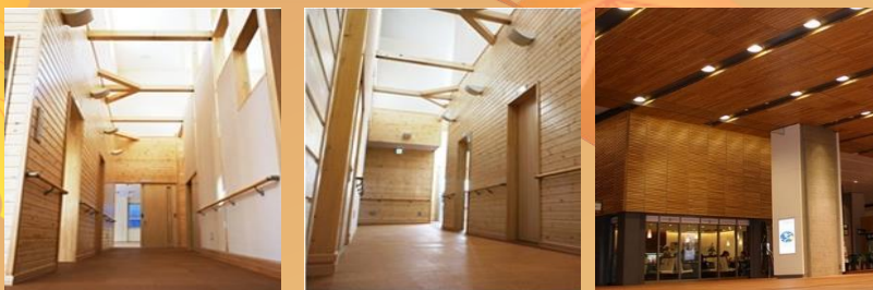
病院や駅など、公共施設にも使えます!

今まで内装制限により使用できなかった場所にも使用が可能になります。 木のぬくもりを感じられる、他とは違った空間づくりにご活用ください!