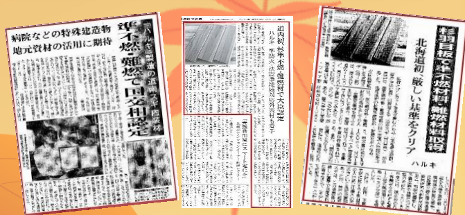
各新聞にも取り上げていただきました。 ありがとうございます。