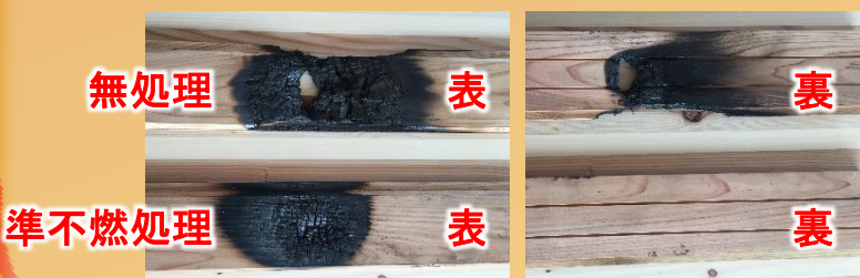
直火を受けても貫通しませんでした!!

試験...試験...さらに試験...。体制の整備・各種手続き...。気が遠くなる開発への日々でした。 そんな日々も、ユーザー様の熱い希望に応えるべく伝統の「ハルキスピリッツ」の元、4年の歳月経て商品化に成功しました!