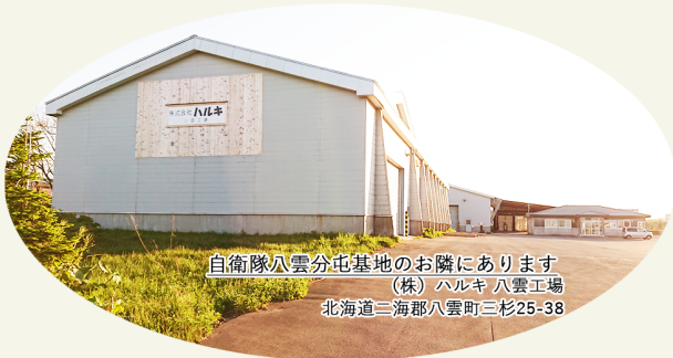
自衛隊八雲分屯基地のお隣にあります (株)ハルキ 八雲工場 北海道三海郡八雲町三杉25-38